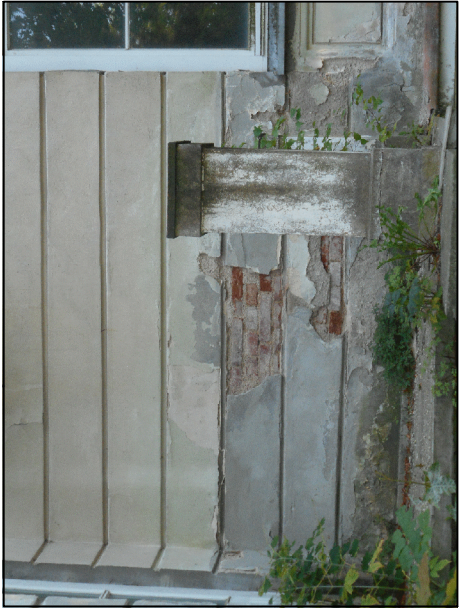
usunięcie splekanych i odspojonych tynków