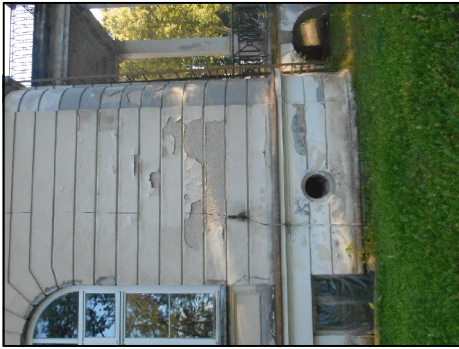
usunięcie splekanych i odspojonych tynków