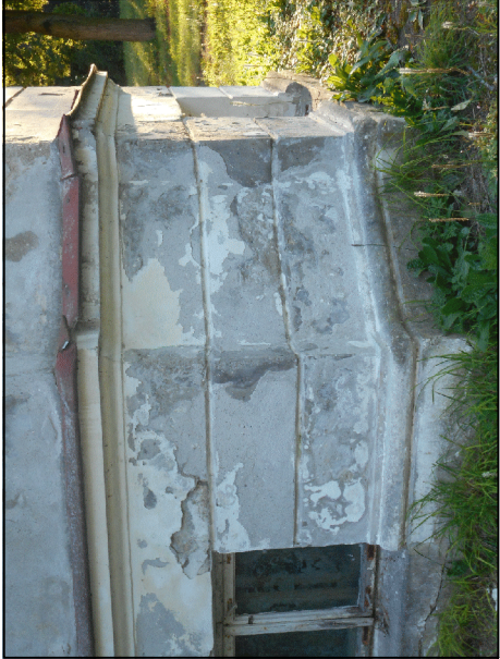
usunięcie splekanych i odspojonych tynków