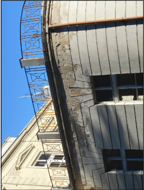
usunięcie splekanych i odspojonych tynków